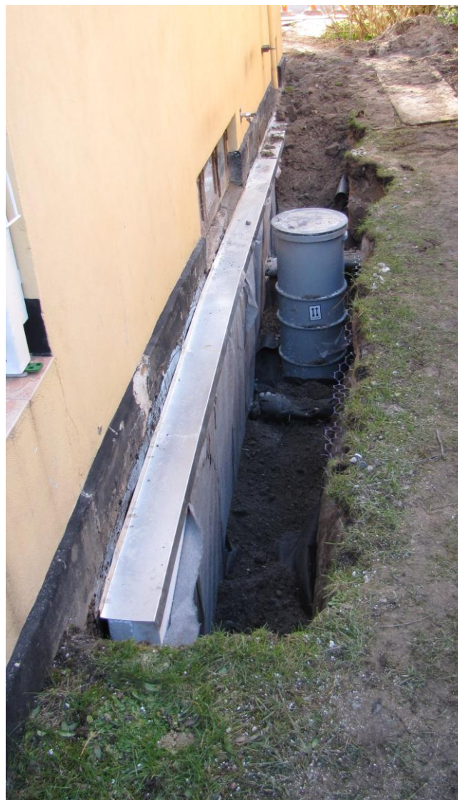
Etablering af udvendigt dræn. Det lodrette rør er en pumpebrønd til drænet.

Sommerens skybrud gav mig kun mindre problemer. Ventilen i mit gulvafløb fungerede