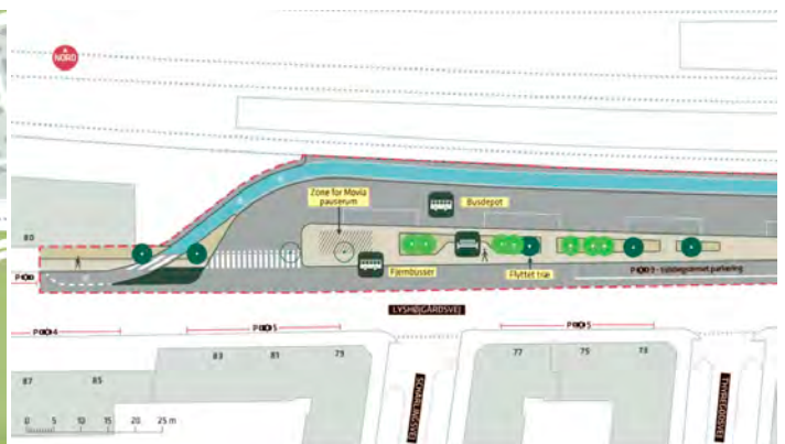
Anlægsområde Bænk(e) Nyt træ (7 stk.) Eksisterende træ (4 stk.), flyttet træ (1 stk.) Træ der fældes (2 stk.)