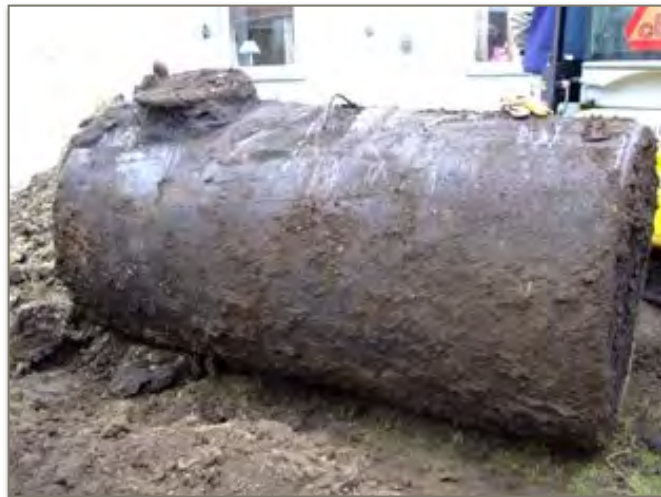
Gamle olietanke kan være en alvorlig sag

http://mst.dk/affald-jord/jordforurening/saerligt-for-borgere-om-forurennet-jord-og-olietanke/skal-min-olietank-udskiftes-se-tidsfrister/