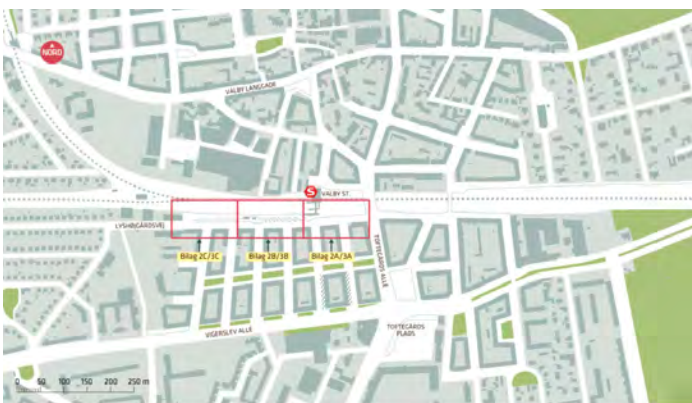
Placering af erstatnings parkeringspladser

For at tilgodese ud- og indstigning ved stationen, bliver der langs arealet med de nye cykelstativer etableret korttidsparkering, 4