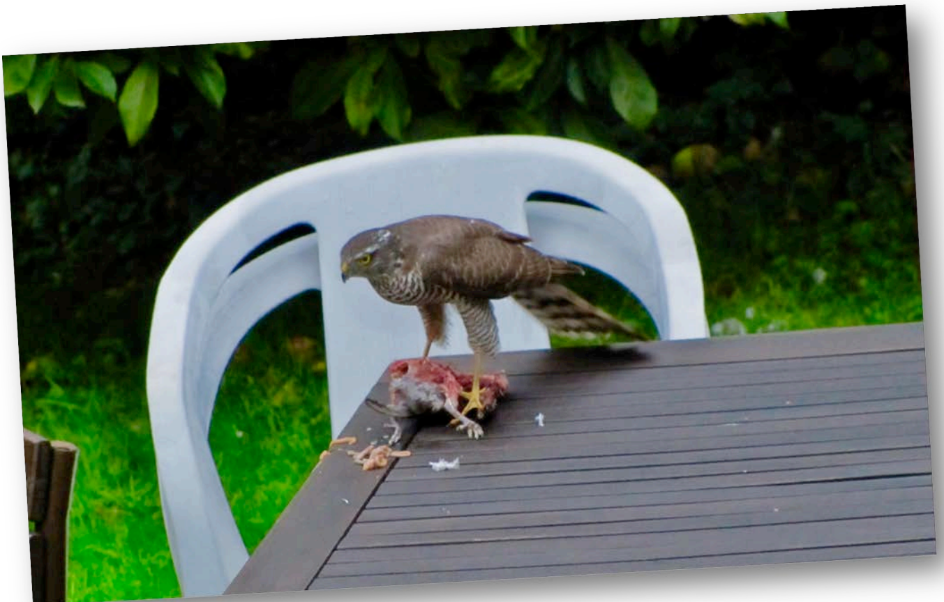
Spurvehøg med frisk fangst, fotograferet i haven Fengersvej 19.