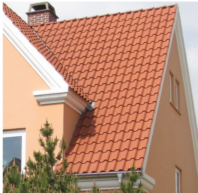
Nyt tag med falsteglsten

Når man lægger nyt tag er det almindeligt at hæve taget en smule for at få plads til undertag og afstandslister. Det kræver strengt taget dispensation fra lokalplanen, fordi det ændrer