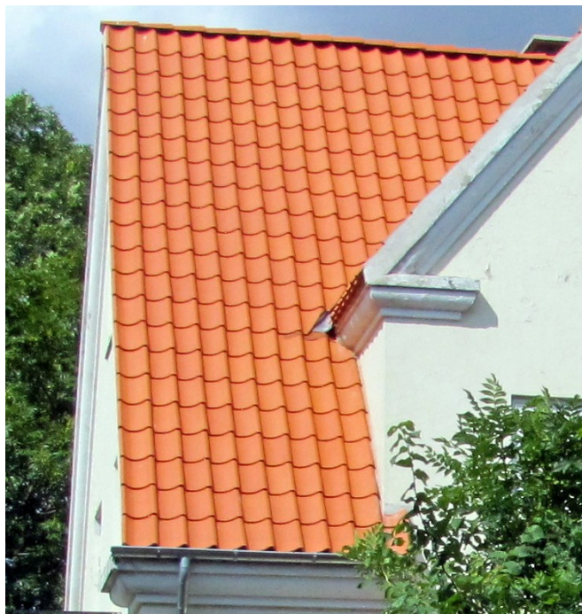
Nyt tag med vingetegl

Tagene på husene i Lyset var oprindelig bygget med såkaldte falsteglsten (se billede). Det er også hvad lokalplanen foreskriver. I de senere år er mange ny tag imidlertid lagt med en anden type tegl, nemlig vingetegl.