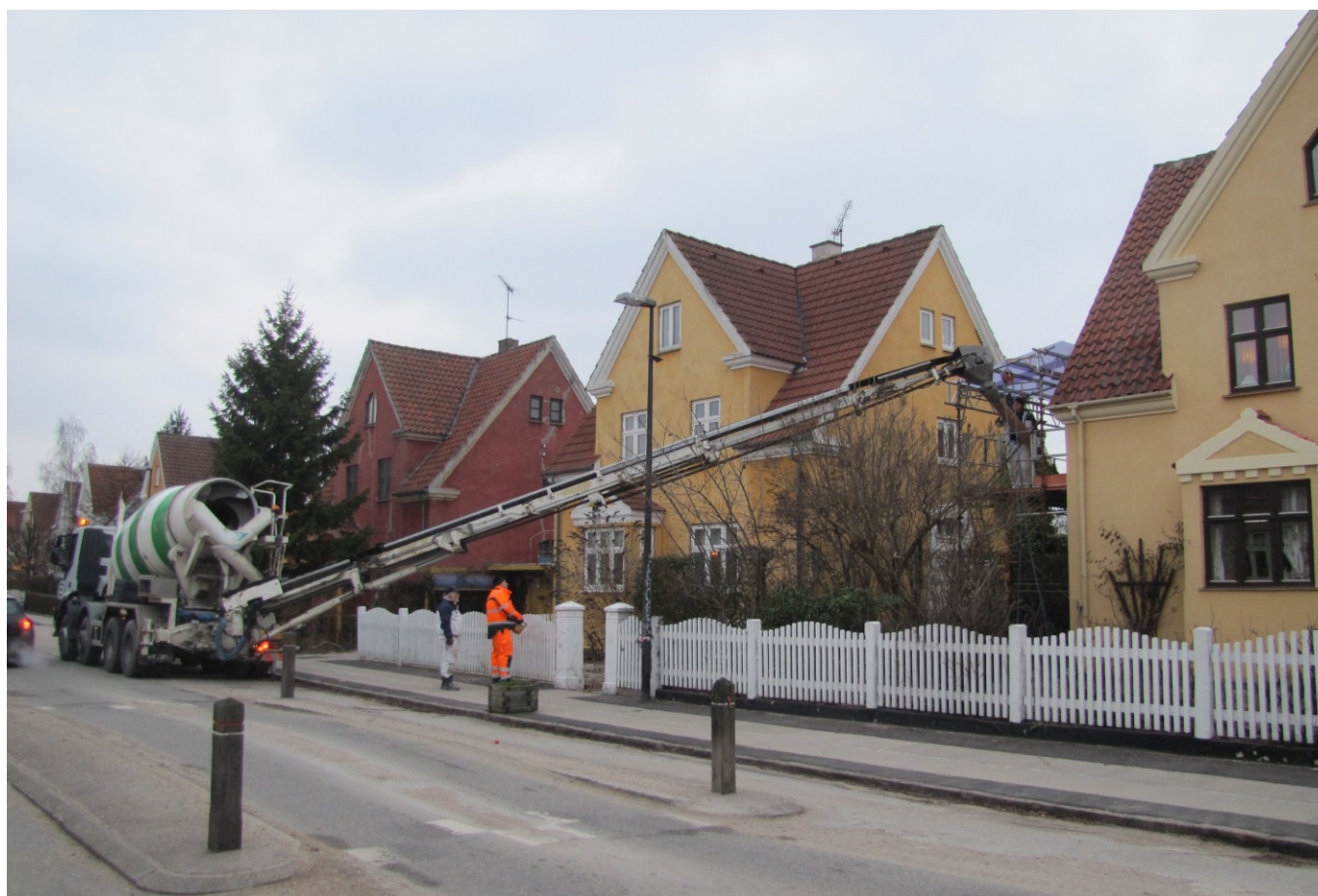
Betonkanonen stikker snablen hen til altanen