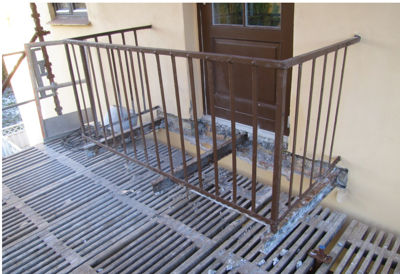
Betondækket er banket ned og jernene lagt fri